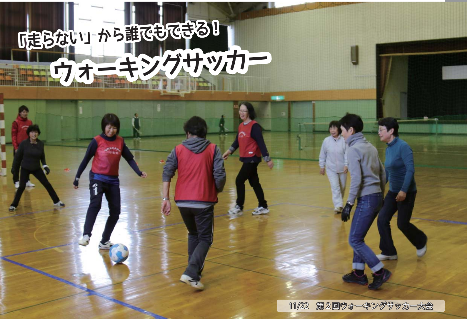
11/22 第2回ウォーキングサッカー大会